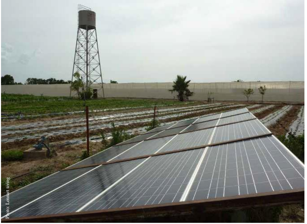
نظام SPIS مع خزان علوي (مرتفع) يُستخدم للريّ داخل وخارج الدفيئة (المُستنبت الزجاجي)